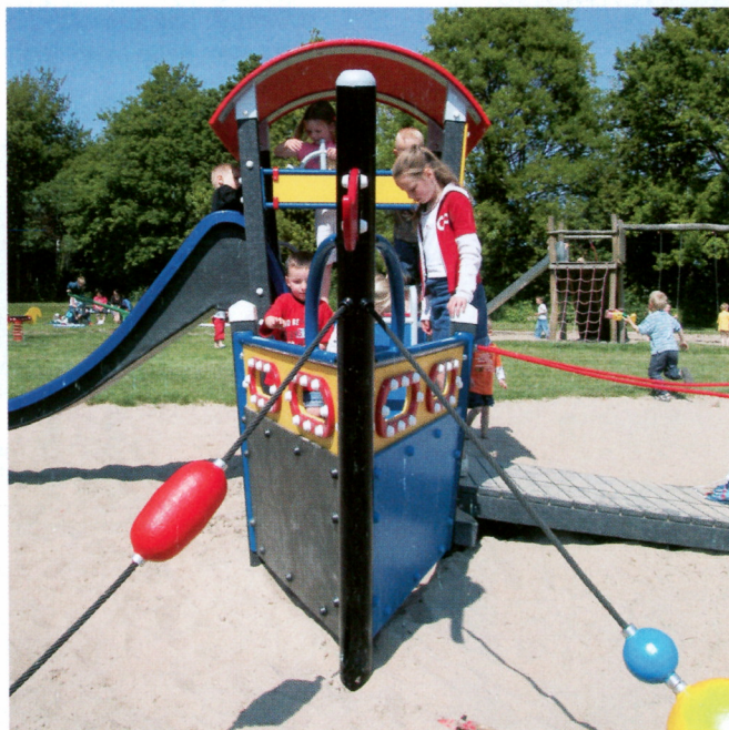
S přátelskou podporou od „Boer Speeltoestellen B.V.“