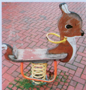
Lakované nebo glazované dřevo se již po několika letech stává nevzhledným nebo se poškodí.